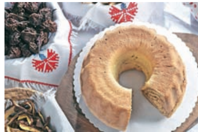
Prepoznavnost Podbreške potice povečujejo tudi zunaj Slovenije.