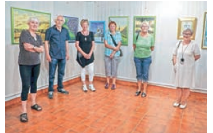
Na drugi pregledni razstavi naklanskih likovnikov se je predstavilo enajst umetnikov iz občine Naklo. Na fotografiji so ustvarjalci, ki so bili prisotni ob odprtju razstave.