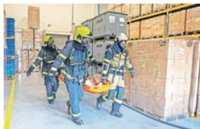
Na vaji so prikazali postopke gašenja, reševanja in oskrbe ponesrečenca.

pelo novo sodobno gasilsko vozilo GVC 16/25 PGD Naklo, ki je lani praznovalo 110-letnico delovanja. Naklanski gasilci so ga v garažo zapeljali že konec lanskega leta, slavnostno pa so ga prevzeli minulo soboto. Gre za gasilsko vozilo s cisterno, ki je popolnoma opremljeno, njegova končna cena pa je po besedah Čer-