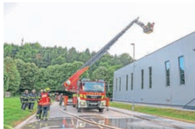
Tradicionalna občinska gasilska vaja je letos potekala pri objektu Orodjarstva Knific.

Kot prvo je na letošnjo občinsko gasilsko vajo pris-