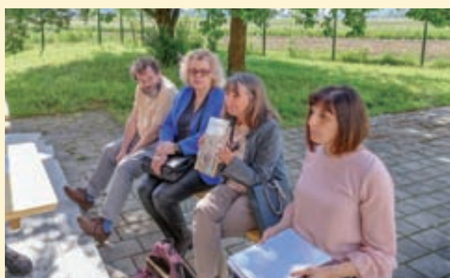
Obisk slepih in slabovidnih na BC Naklo, junija 2021