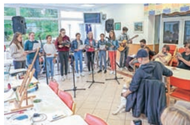
Nastopili so učenci OŠ Naklo.