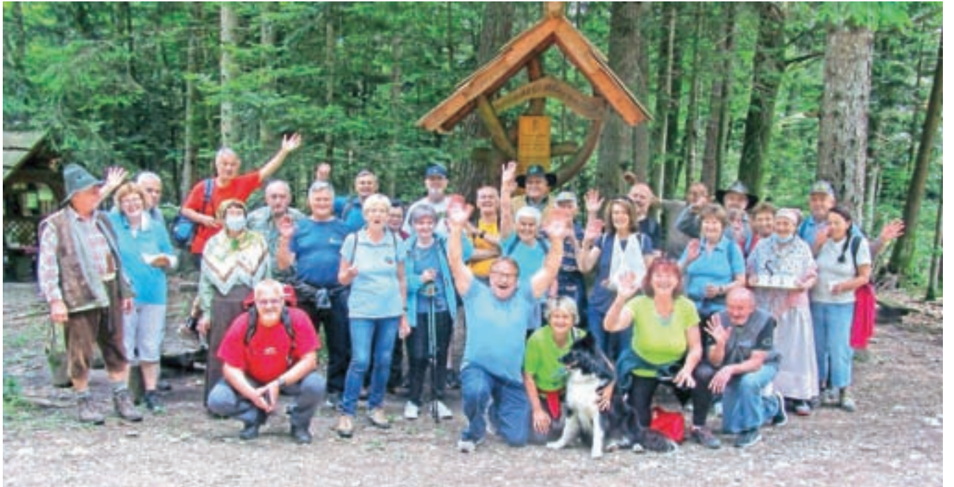
Pohodniško točko obiščejo številni posamezniki in skupine, tudi otroške. Pri jelki so bili tudi upokojenci Ministrstva za obrambo z Gorenjske (na sliki).

plje do turistične in pohodniške točke Pod krivo jelko v osrčju gozda. Zadnja leta je društvo s pomočjo Občine Naklo vložilo v nujno obnovo Vogvarjeve hiše kar nekaj denarja in prostovoljnega dela. Društveni prostovoljci so poskrbeli tudi za bolj urejene in vidneje označene poti do krive jelke in do drugih zanimivosti Udin boršta. Na 18 kilometrih poti je kar 64 tabel! Kulturno in turistično dru-