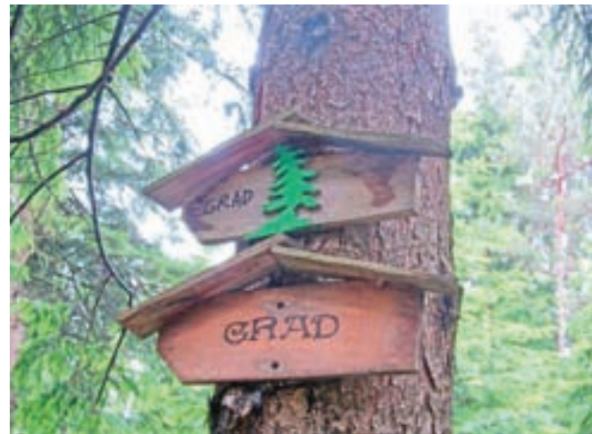
Obnovljeni kažipoti na pohodniških poteh

in bogatim vlivali strah v kosti. Današnji rokovnjači so prijaznejši in vsakogar prijazno povabijo k jelki, kjer jim ženski del rokovnjaške družbe ponudi okrepčilo. Za mlajše obiskovalce pripravijo tudi družabne igre, zakurijo ogenj in povedo veliko zanimivega o rokovnjaških časih. Streljaj od glavne poti nastaja pod smrečicami, v mahu, prava pravljurna vas, kamor otroci polagajo najrazličnejše igračke, figurice, hiške ... Vredno ogleda. Posebnost poti so štiri z ljubjem pokrite