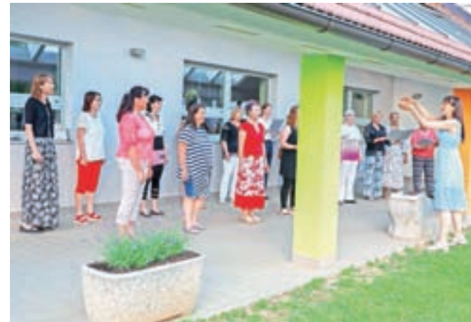
Ženski pevski zbor Dupljanke se je predstavil s tremi pesmimi.

tične skupnemu petju v živo. Kljub vsemu smo vesele, da se je zbor ohranil in bomo nadaljevale tradicijo dupljskega ženskega petja." Poletju v pozdrav so zapele skladbe Škrjanček poje, Preljubi fantič moj, Pa kako bom ljubila. Z enakim repertoarjem so nastopile še naslednji dan v Kranju, isti dan pa so peletudi na poroki ene od njihovih članic. Dupljanke letos praznujejo tridesetletnico delovanja, ob tej priložnosti obljublajo retrospektivni koncert, ki bo glede na epidemiološko stanje jeseni ali spomladi prihodnje leto.