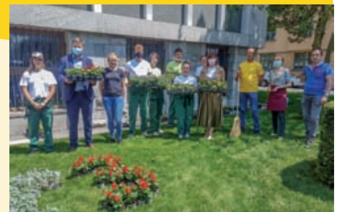
Dijaki in mentorji Srednje šole BC Naklo skupaj s predsednikom Državnega zbora Igorjem Zorčičem, junija 2021