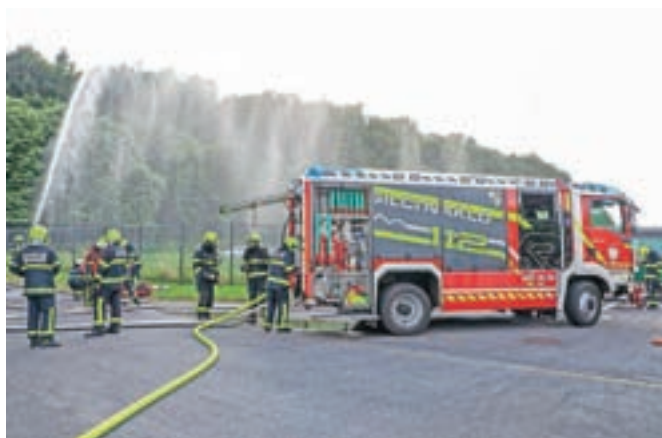
Novo gasilsko vozilo Prostovoljnega gasilskega društva Naklo