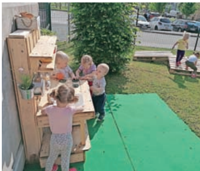
"Osvežitev" iz vrtno kuhinje, ki jo je iz palet sestavil hišnik.

Potreba po gibanju in igri je temeljna otrokova potreba. Ena od njih pa je tudi "osvežitev" iz vrtno kuhinje, ki nam jo je iz palet sestavil naš hišnik.